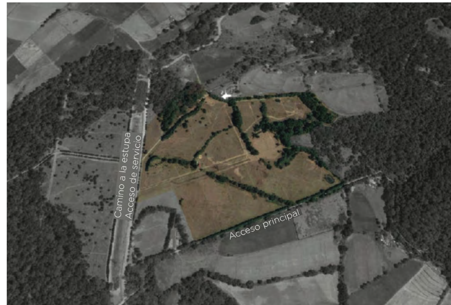
Superficie del terreno 28 Ha. 2 accesos (1 acceso principal y 1 de servicio)

El predio tiene una ubicación muy privilegiada en la mejor zona de Acatitlán (camino a los Alamos), a menos de 15 minutos de la autopista de Valle de Bravo; misma distancia a la que esta de Avándaro, el lago y del centro de Valle de Bravo.